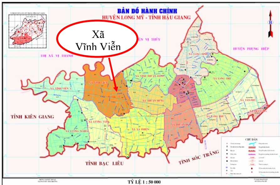
Hình 1: Vị trí của xã Vĩnh Viễn

▲ Thủy văn : Xã Vĩnh Viễn được giới hạn bởi hai hệ thống sông lớn là sông ả ước Đục và sông ả ước Trong và hệ thống kênh rạch chằng chịt. Do hệ thống sông rạch của vùng nên xã Vĩnh Viễn cũng bị ảnh hưởng của sông Hậu đồng thời chịu ảnh hưởng của chế độ nhật triều biển Tây qua hệ thống sông Cái Lớn. ả hờ địa hình tương đối cao và mực nước lũ không cao (trung bình 0,36m) nên khi thủy triều lên không gây ngập úng nhiều vào mùa mưa lũ, nhưng lại bị ảnh hưởng mặn vào mùa khô, nhất là từ tháng 3 đến tháng 4 hàng năm. ả hìn chung, nguồn nước đáp ứng được nhu cầu sản xuất nông nghiệp và nuôi trồng thủy sản của xã.