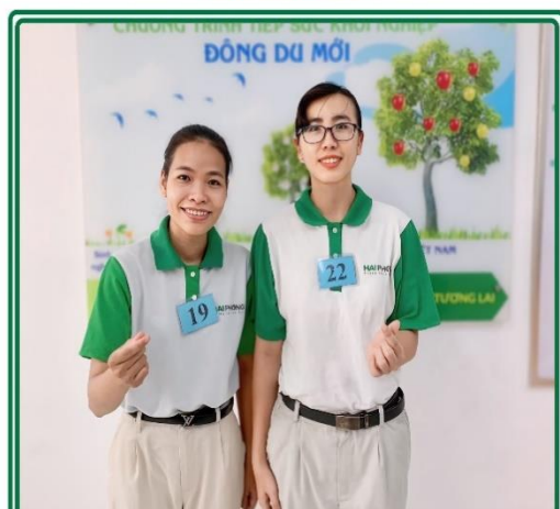
Hình ảnh 2 bạn sinh viên Trường Đại học Cần Thơ trúng tuyển Chương trình Nissan vào tháng 3.2024

HAI PHONG Tương lai cho bạn CHÚC MỪNG TRÚNG TUYỂN 25/03/2024