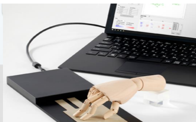
Hình ảnh nơi làm việc – Một số sản phẩm cảm biến

HAI PHONG Tương lai cho bạn CHÚC MỪNG TRÚNG TUYỂN 25/03/2024